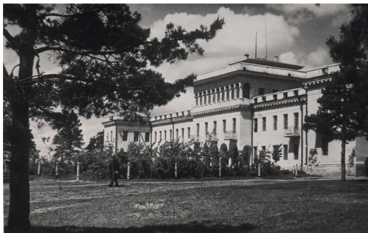
Бывший Дома отдыха партактива – сельхозтехникум. Открытка 1957 г.

Проектирование велось в 1938 г., а строительство осуществлено за два года, с сентября 1938 г. по 1940 г. [3, л. 97–98]. Пока новый дом отдыха только проектировался, в его качестве временно использовались здания бывшей архиерейской дачи «Знаменская роща» в г. Курске, куда было прикреплено партийное руководство обкома [4, л. 48, 188].