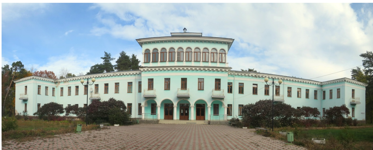
Дворец. Вид с юга. октябрь 2021 г.

Документы и материалы подтверждают следующие исторические этапы строительства и работы в здании значимых учреждений различных функций – отдыха, учебной, оздоровительной: 1940–1947 гг. – дома отдыха партактива; 1948–1963 гг. – сельскохозяйственная школа, затем сельскохозяйственный техникум; 1963–2020 гг. – детский санаторий; с сентября 2020 г. – детская клиническая больница.