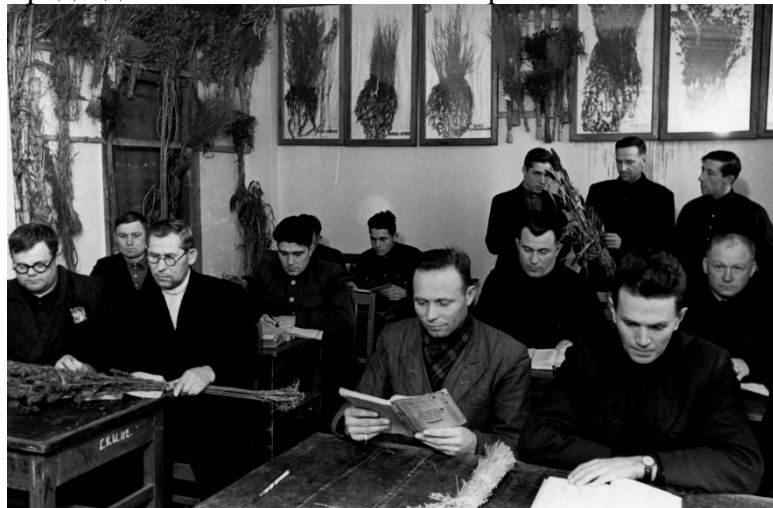
Учебное помещение главного корпуса. Курсанты одногодичных курсов сельскохозяйственной школы председателей колхозов на уроке по растениеводству. Фото около 1951–1952 гг.

С 31 марта 1951 г. здесь были организованы: Курская сельскохозяйственная школа по подготовке председателей колхозов Министерства сельского хозяйства РСФСР, с мая 1953 г. – Курская средняя сельскохозяйственная школа по подготовке председателей колхозов Министерства сельского хозяйства и заготовок РСФСР, с декабря 1953 г. – Курская средняя сельскохозяйственная школа по подготовке председателей колхозов Министерства сельского хозяйства РСФСР.