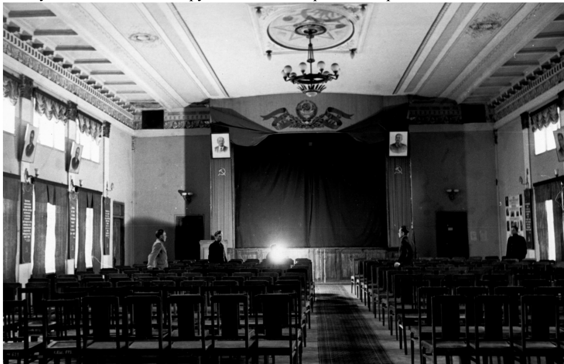
Парадный актовый зал главного корпуса (клуб). Фото около 1952 –1953 гг.

Техникум имеет водонапорную башню, в которую подается вода из 2-х водяных скважин: одна глубокая на 150 м, другая на 180 м. В летнее время водой техникум обеспечивает и окружающий пионерские лагеря.